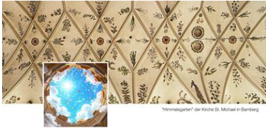
"Himmelsgarten" der Kirche St. Michael in Bamberg

Sonntag, 07. September, 15 Uhr Kloster Michaelstein